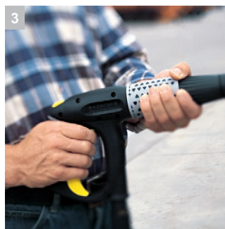
3 Servo Control