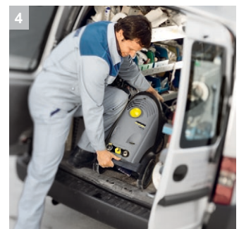
4 Ottima maneggevolezza