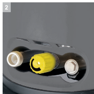
2 Pressione e portata regolabili all'infinito sulla pistola