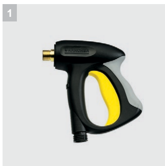
1 Pistola Esay Press