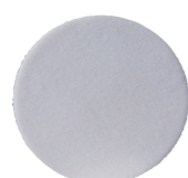
Cuffia feltro Attacco velcro Per rimozione cera