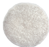
Cuffia in lana Attacco velcro Per lucidatura