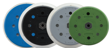
Platorelli in gomma Attacco velcro